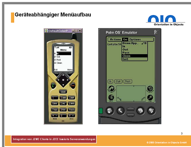
Abbildung 3: Geräteabhängiger Menüaufbau