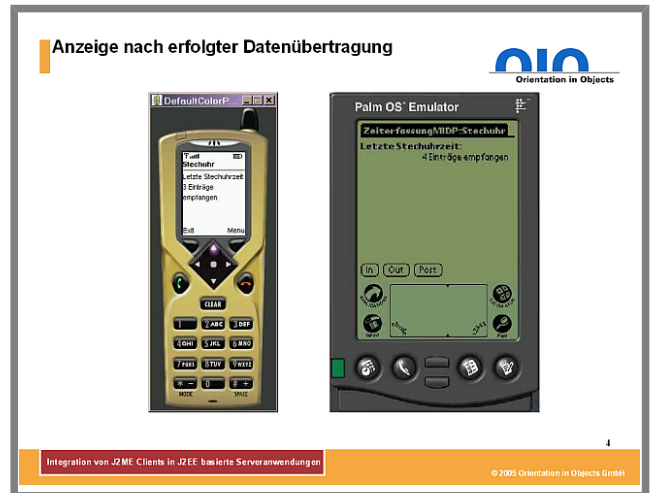
Abbildung 4: Anzeige nach erfolgter Datenübertragung