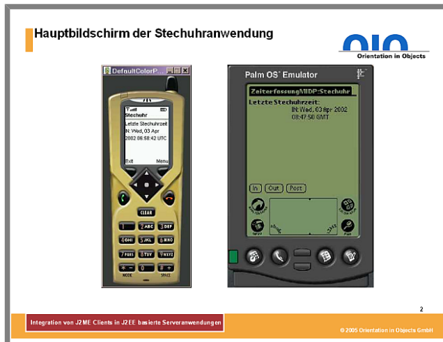
Abbildung 2: Hauptbildschirm der Stechuhranwendung